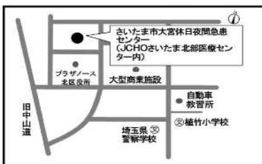
▼さいたま市大宮休日夜間急患センター