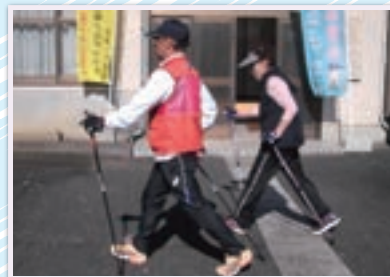
歩く姿もかっこいい…

3か月ごとに“大人の遠足”として、ポールを相棒に遠足にも行くそうです。みなさんも一緒にいかがですか？