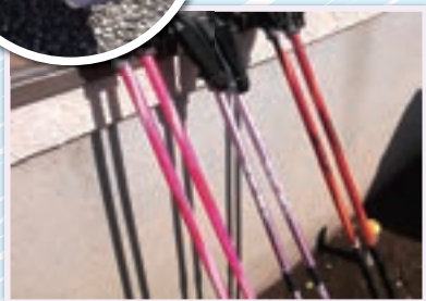
カラフルなポール♪