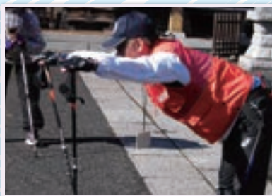
ウォーミングアップにもポールが登場！