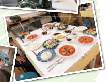
仲間のサポートあり