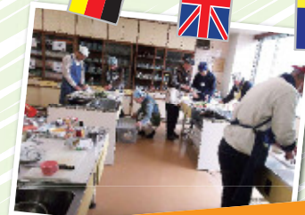
先生のデモンストレーションあり

仲間と一緒に作った食事を食べる瞬間は、 仕事と違った満足感が得られます。 食を通して体を整え、仲間との集い を通して心のリフレッシュをしませんか？