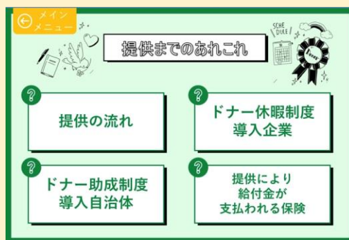
● 骨髓バンクスペシャルサイトにリンク