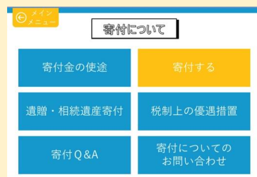
● 寄付に関する情報