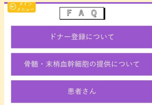
● カテゴリーごとのFAQを表示