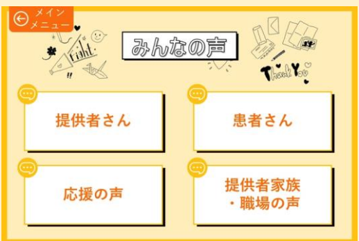
● 骨髓バンクスペシャルサイトにリンク