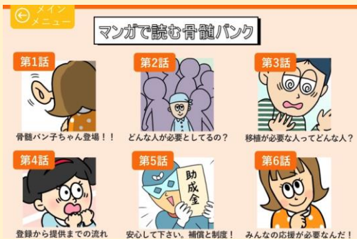
● 骨髓バンクスペシャルサイトにリンク