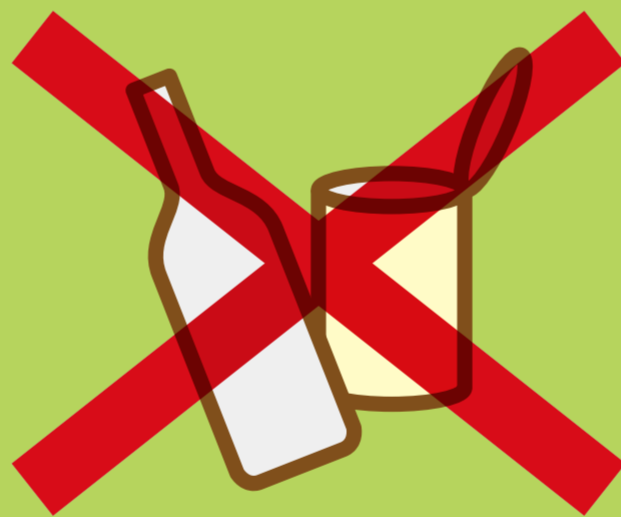
屋外に放置された 空きビン・缶、ペットボトル