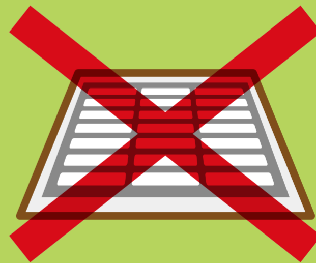
雨水ますや 排水ます

ジカウイルス感染症(ジカ熱)やデング熱の原因となるウイルスは、それらの感染症に感染した人の血を吸った蚊(日本ではヒトスジシマカ)の体内で増え、その蚊がまた他の人の血を吸うことで感染を広げていきます。