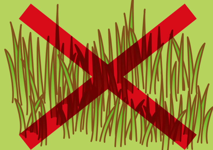
風通しの悪い やぶ・草むら