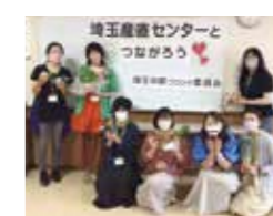
産地・商品学習交流