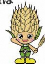
上里町マスコット キャラクターこむぎっち