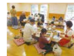
居場所・みらいひろば