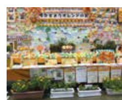
介護・認知症 学習普及