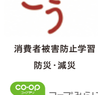
消費者被害防止学習 防災・減災