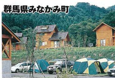
群馬県みなかみ町

住所:みなかみ町相俣159-1 TEL:0278-66-0402 FAX:0278-66-0137