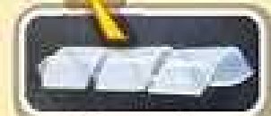
危険なコードをバンドですっきり