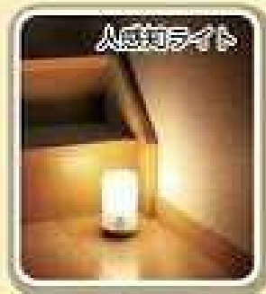
人が通ると自動的に点灯し、一定時間経過後消灯します。