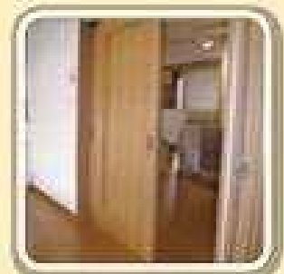
取手が無い引き戸に変更