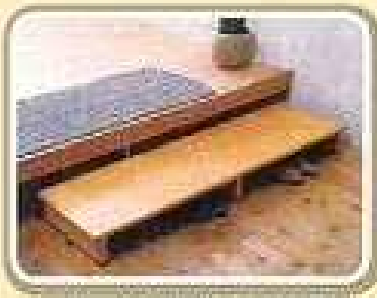
玄関、縁側に踏み台を設置