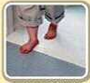
カーペットの段を小さく