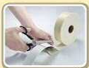
カーペット用両面テープ