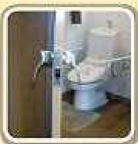
押すだけで開くドア