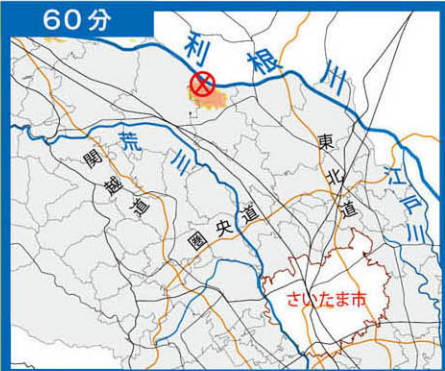
利根川 (右岸) 157.0km

この図は、利根川右岸 157.0km(利根川の河口から157.0kmの場所)で破堤した場合、江戸川右岸 55.5km(江戸川の河口から55.5kmの場所)で破堤した場合、どのくらいの時間でどこまで浸水するかをシミュレーションしたものです。