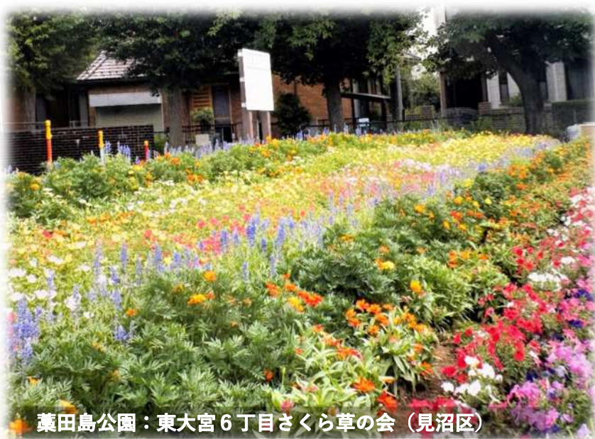
蕨田島公園：東大宮6丁目さくら草の会（見沼区）

各種講習会を開催し、多くの来場者 で賑わう春の一大イベントです。 花いっぱい運動推進会の皆さんも参 加しています！