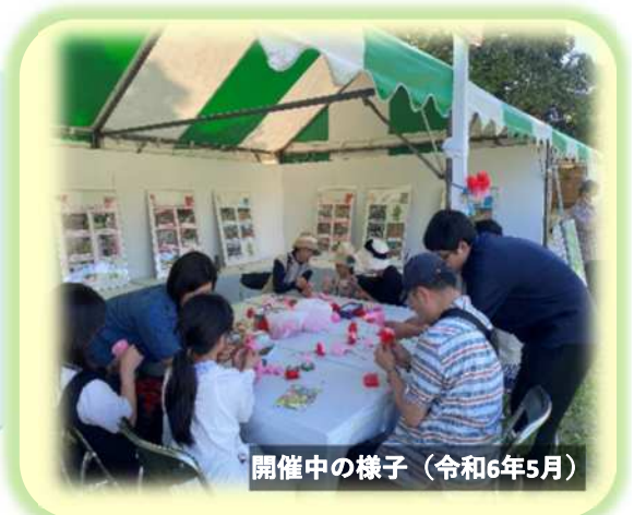
開催中の様子（令和6年5月）