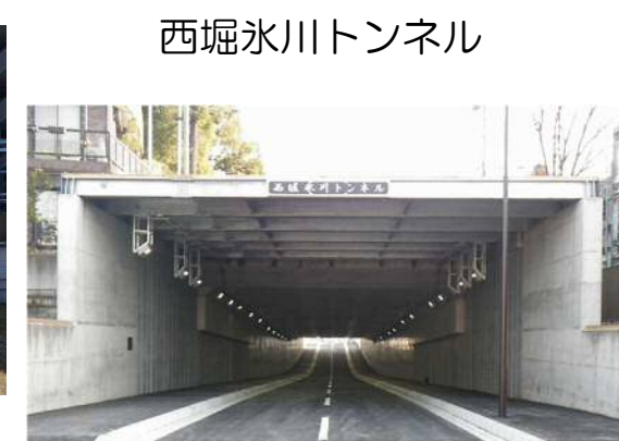
完成後【平成30年1月】撮影