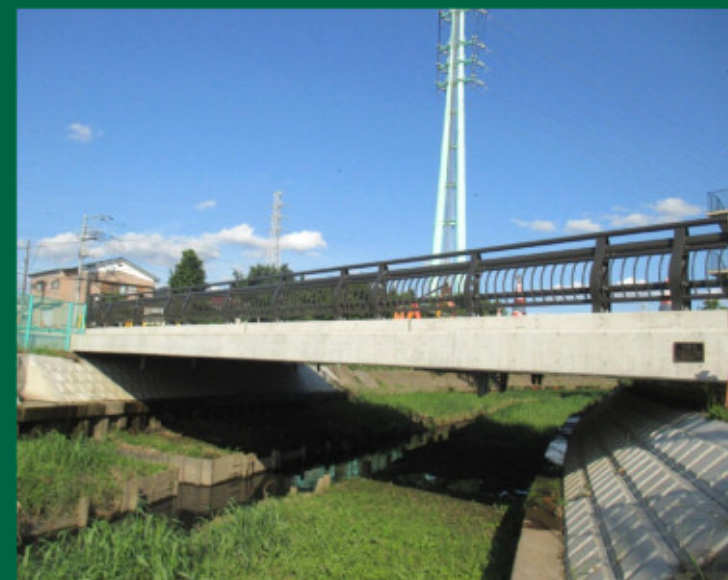
吉野橋 【平成28年5月竣工】