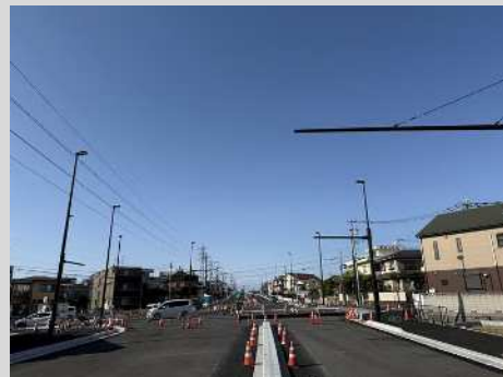
産業道路天沼工区の現在の状況(令和7年12月時点)