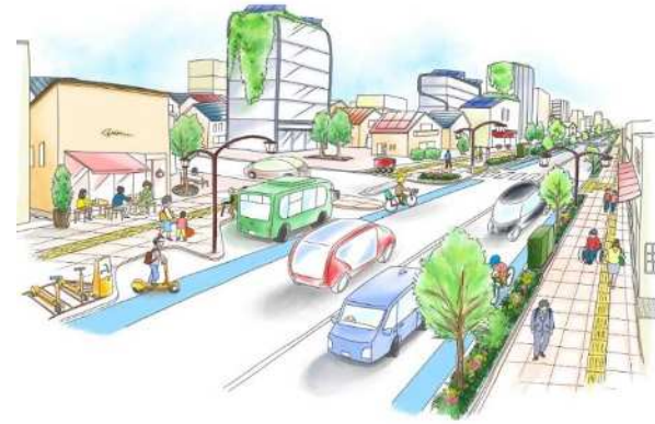
安全・安心な都市生活に資する道路