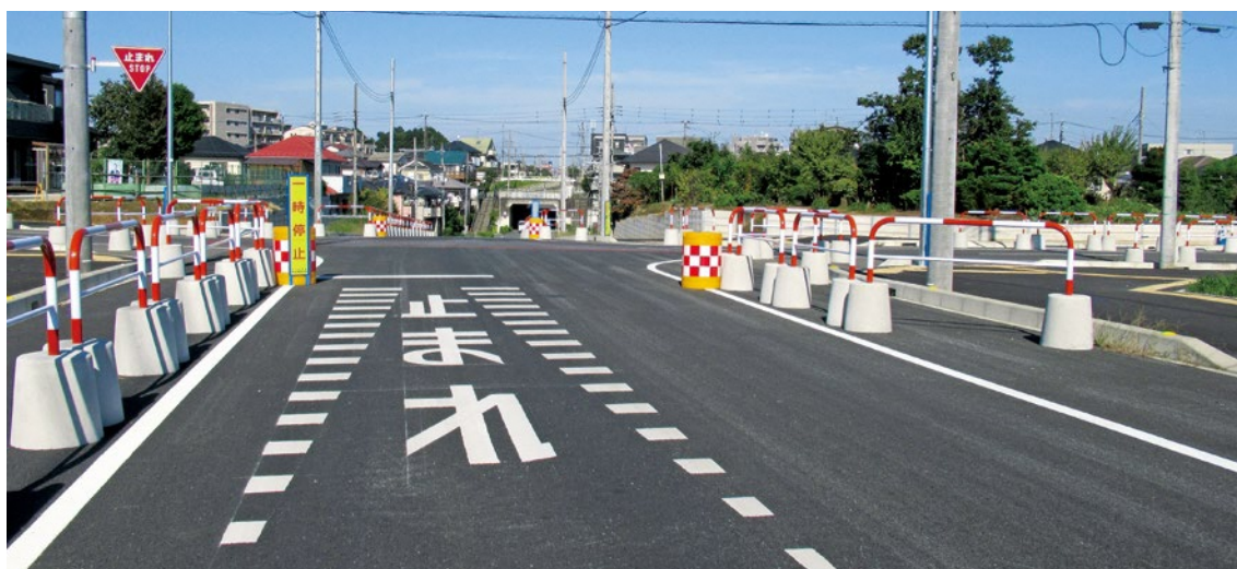
（南浦和東口大間木線 中尾3号線 区12-1号線 交差点付近）