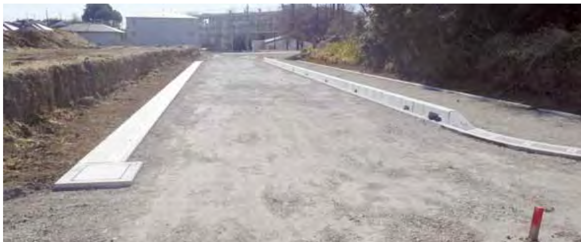
中尾小学校北側（区9-1号線）