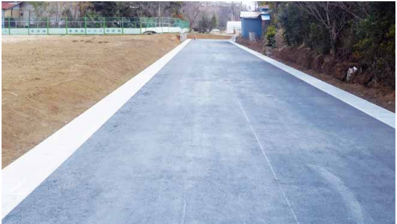
(区 6 - 1 6 号線)

平成 28 年度は 22 戸の建物移転等のご協力をいただき、さらに道路築造工事を 2 本実施しました。これで事業当初からの移転済戸数は 233 戸となり、地区全体の移転予定建物 564 戸のうち約 41.3% が移転となりました。そして、28 年度末現在の総事業費に対する進捗率は、約 42.8% の見込みです。