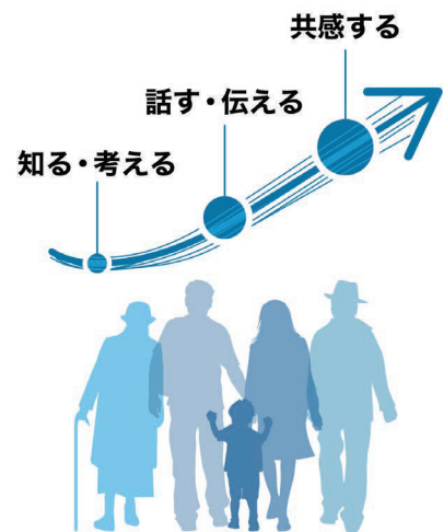
図 浦和のファンづくりのステップ