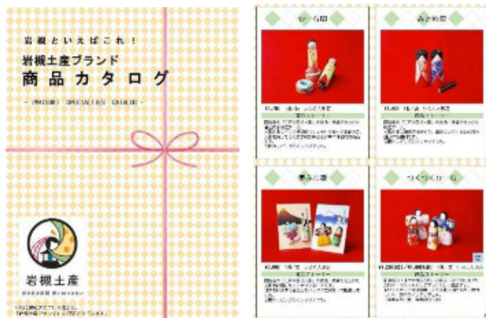
岩槻土産ブランド商品カタログ