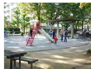
3位 いろいろな遊び場