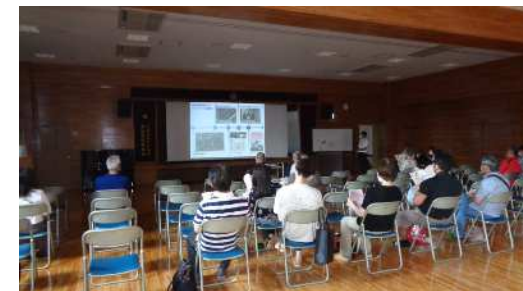
6月25日の説明会の様子