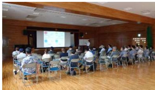
6月21日の説明会の様子