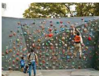
1位 アーバンスポーツパーク