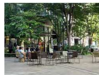
3位 緑の中のカフェテラス