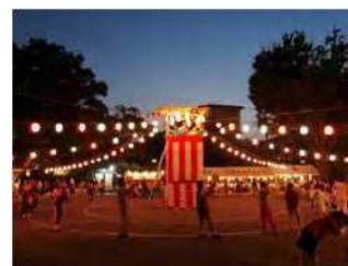
2位 イベントやお祭り