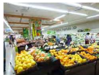
2位 手頃なスーパー