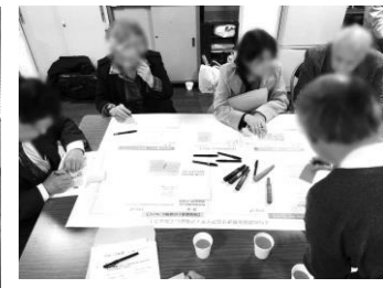
グループ会議の様子