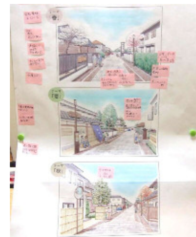
イメージスケッチ案の修正点

1班と2班の発表内容を基に、参加者全員でイメージスケッチ案の修正点とまちなみづくりの進め方について話し合い、意見をまとめた結果は以下のとおりです。