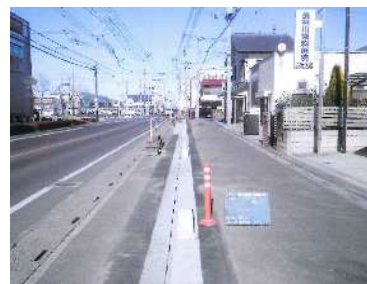
区画道路9号線築造工事 (R6)