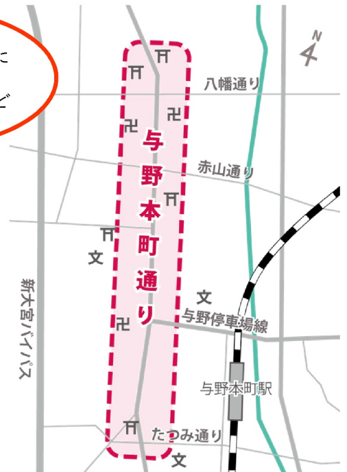
与野本町通りの位置図