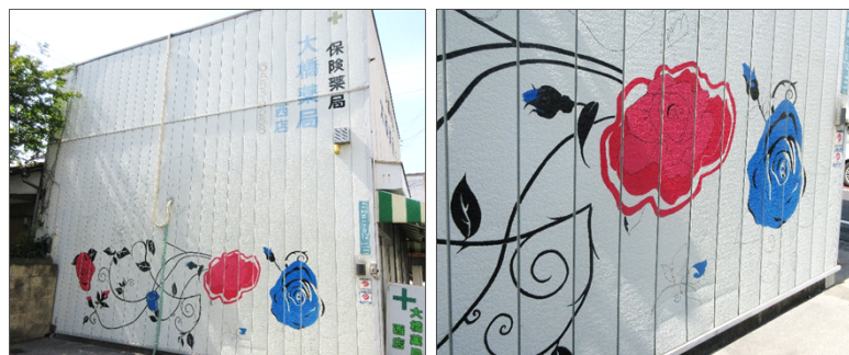
▲アートの作成状況