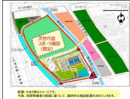
配置・大きさはイメージです。今後、民間事業者の提案に基づいて、最終的な施設配置を決めていきます。