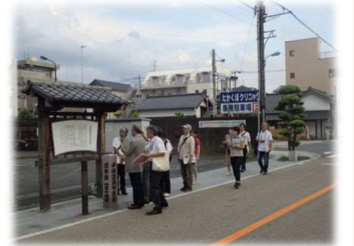
現地視察の様子 (写真は中仙道蔵宿)