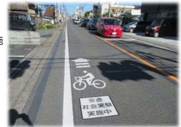
社会実験実施中の様子