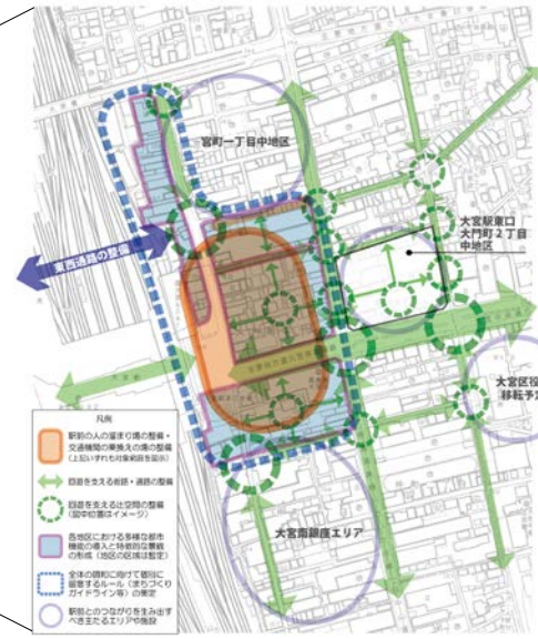
▲大宮駅東口のまちづくりの概念図

「整備方針（案）」の対象範囲となるターミナル街区のうち“大宮駅東口”を中心に「駅」、「交通基盤」、「周辺まちづくり」の考え方を整理しています。