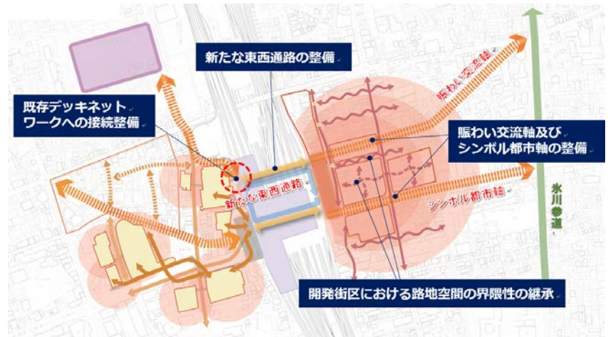
▲歩行者ネットワークの具体的な取組内容

上記の5つの項目それぞれについて、「取組内容、個別整備計画において検討すべき事項」を整理しています。