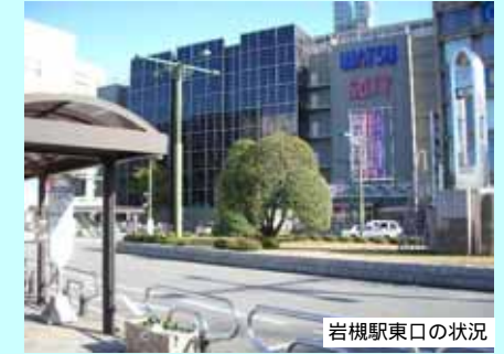
岩槻駅東口の状況