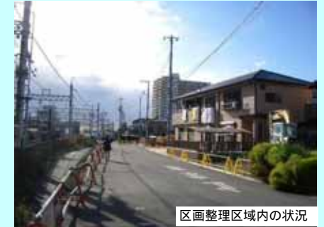
区画整理区域内の状況