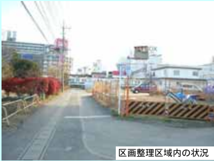
区画整理区域内の状況