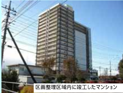
区画整理区域内に竣工したマンション