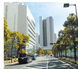
都市計画道路内谷別所線