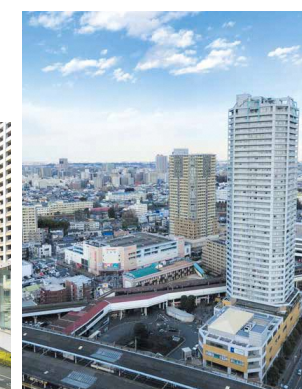
東口交通広場、ライブタワー(右)、ミュージシティ(中央)