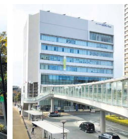
サウスピアに直結する歩行者デッキ