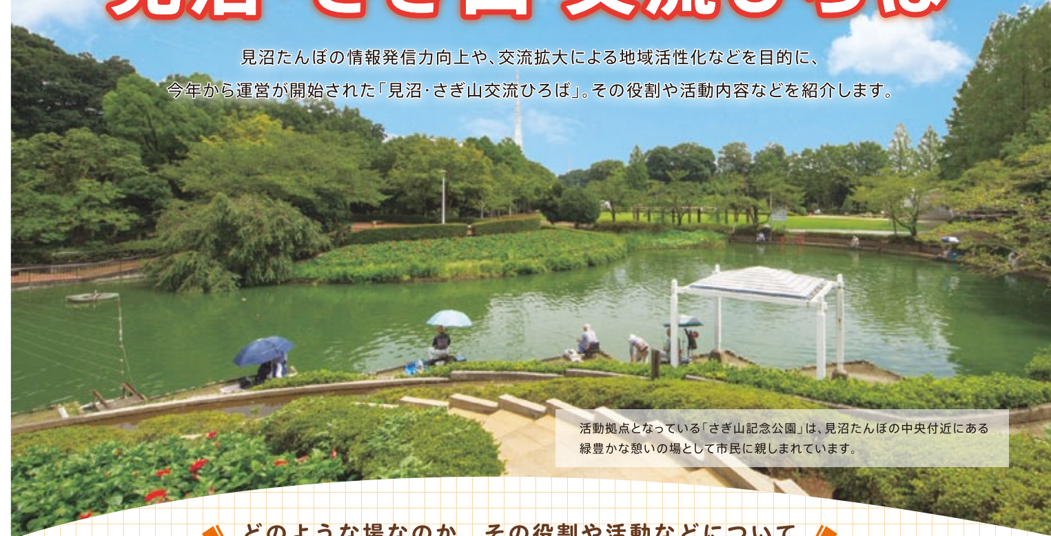
活動拠点となっている「さぎ山記念公園」は、見沼たんぼの中央付近にある緑豊かな憩いの場として市民に親しまれています。

見沼たんぼの情報発信力向上や、交流拡大による地域活性化などを目的に、今年から運営が開始された「見沼・さぎ山交流ひろば」。その役割や活動内容などを紹介します。