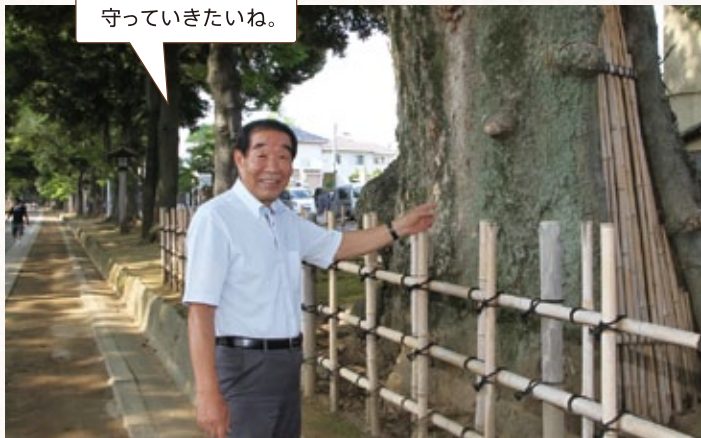
会員たちが自ら製作した竹垣で樹木を保護