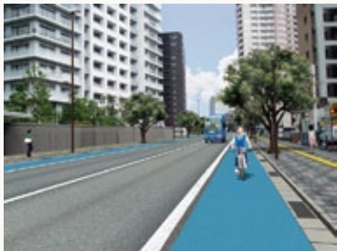
氷川緑道西通線イメージパース(地図④)

氷川参道の周辺エリアでは、交通渋滞の緩和や自転車レーンの設置などを目的とした「氷川緑道西通線」の整備や、大宮区役所の埼玉県大宮合同庁舎跡地への移転・新庁舎建設計画などが、一体となって進められています。