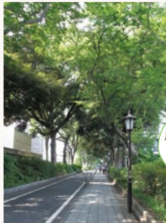
歩道と車道が分離された緑道