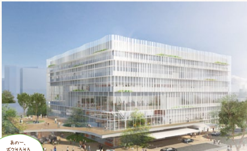
大宮区役所新庁舎イメージパース