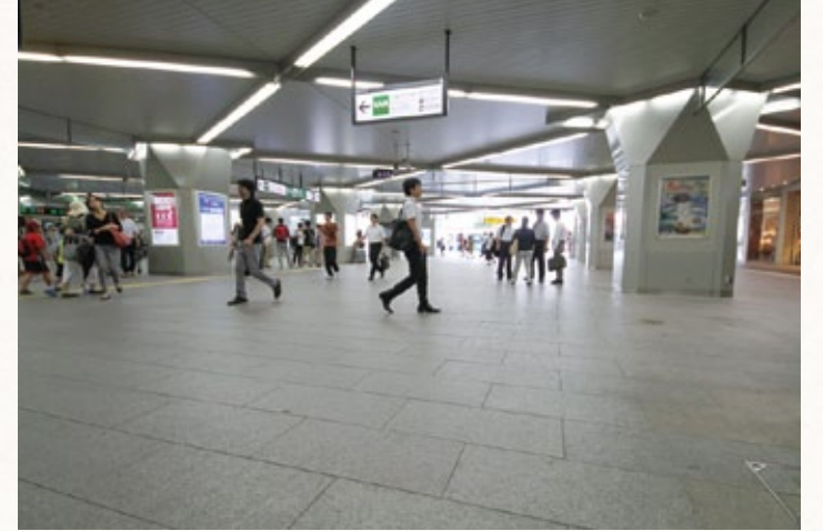
駅の東西を結ぶ連絡通路