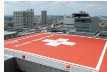
災害医療等に対応するための屋上ヘリポート