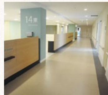
東西で色分けされた病棟受付