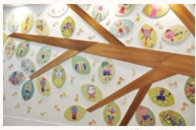
子どもたち手作りの壁面アート

●地上13階・地下1階、延床面積65,448㎡、病床数316床 新生児集中治療室 (NICU) や新生児治療回復室 (GCU) の増床のほか、ハイブリッド手術室なども新設。発達障害総合支援センター (仮称) や、入院中・通院中の児童生徒が学べる特別支援学校などの機能も付加されています。