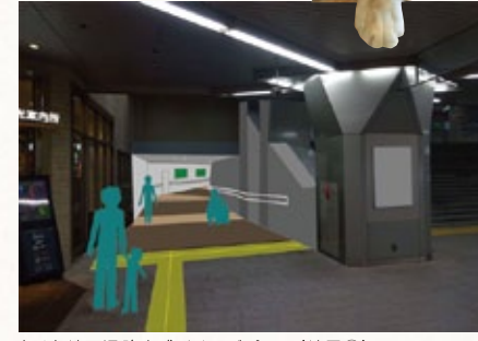
中ノ島地下通路完成イメージパース (地図④)