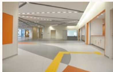
彩り豊かなラウンジ