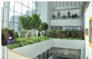
緑のある院内の空間