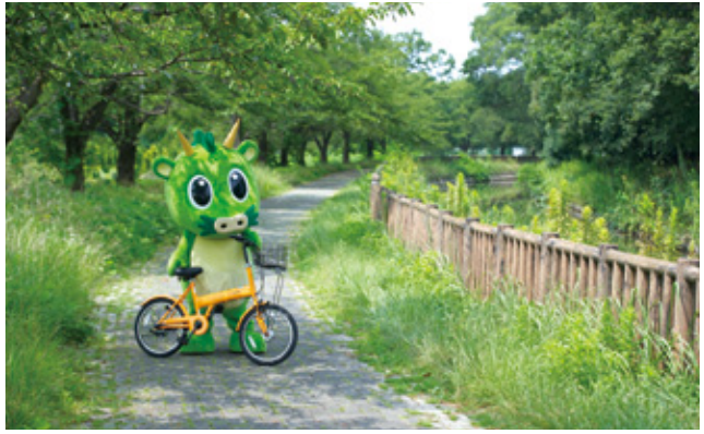
▲木柵が特徴の国昌寺付近