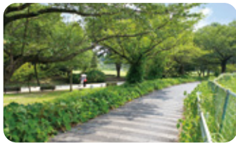
▲大自然を感じる見沼自然公園付近

見沼代用水路は桜並木や新緑、彼岸花など、季節によって変わる美しい自然を楽しむことができます。また少し足をのぼせば、水辺に芝生が生い茂る、東京ドーム約2.3倍の敷地面積を誇る見沼自然公園をはじめとする、美しい公園をめぐることもできます。大自然を満喫することができるヘルシーロードに、足を運んでみませんか？