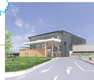
指扇駅北口 完成イメージ図

指扇では現在、市民の皆さんの利便性を図るため、駅の橋上化や南北自由通路、北口駅前広場の整備を行っています。北口開設や温もりが感じられ親しみのある交通広場をテーマに、駅前広場の整備を進めます。そうすることで、南口に集中していた自動車交通の分散を図り、交通安全性にも優れ、花と緑が感じられる質の高い駅前拠点を目指していきます。