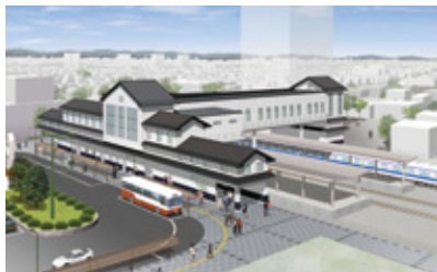
岩槻駅東口 完成イメージ図

岩槻では現在、東武鉄道野田線岩槻駅の改修事業を行っています。長い歴史のある、城下町岩槻にふさわしい白壁をイメージさせるデザイン。そして橋上化と併せ、東西自由通路設置による西口の開設やバリアフリー化など、市民の皆さんの利便性などを考えたつくりになっています。貴重な歴史・文化を伝えるまちとしてさらに発展するよう、新しい岩槻駅にご期待ください。