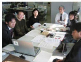
▲モニターさんとの和気あいあいの作業風景