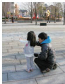
▲表紙の撮影のひとつコマ