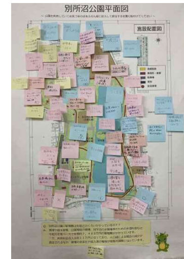
ワークショップの結果