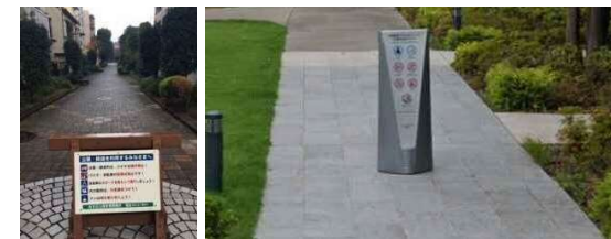
サイン(看板)設置イメージ<移動できるもの> (看板の具体的なデザイン・文言は協議会で決定)