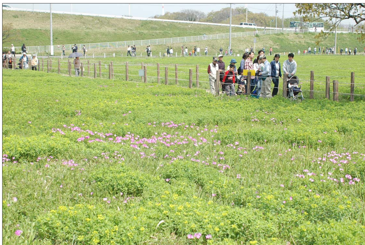
田島ヶ原サクラソウ自生地

区名にもある「桜」と市の花でもある「サクラソウ」をはじめ、その他の草花が荒川沿いからさらに市街地まで広がっていくような景観づくりを図り、住む人のみならず、訪れた人も美しいと感じることのできる、魅力あふれる景観を目指します。