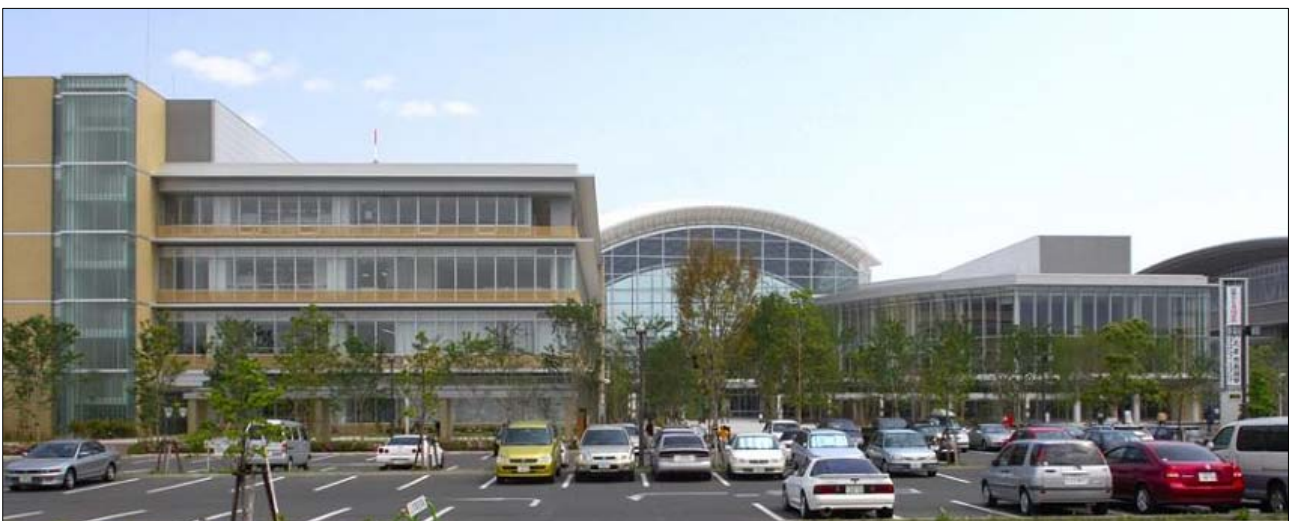
桜区役所とプラザウエスト

また、区内には大久保古墳群や社寺、田島の獅子舞や宿・神田の祭ばやしなどの歴史や文化を伝える景観資源も豊富に残されています。