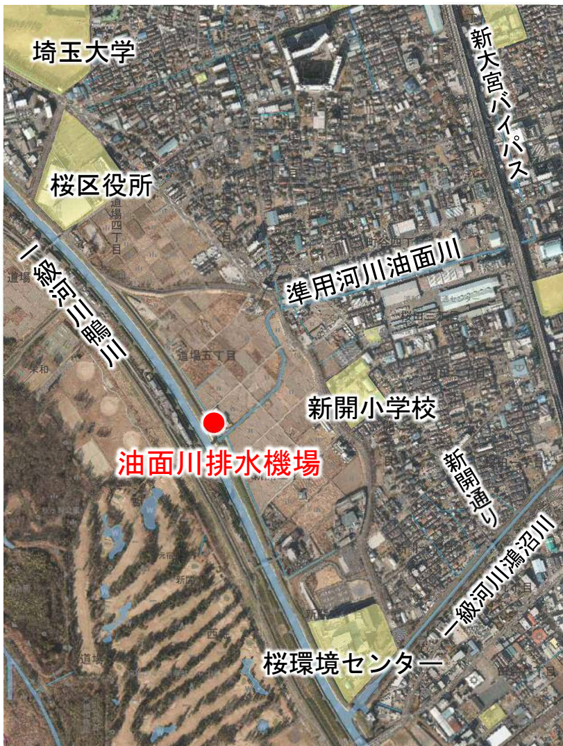
▲桜区を流れる油面川と鴨川