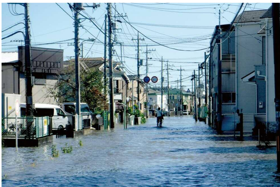
▲令和元年台風第19号浸水被害状況