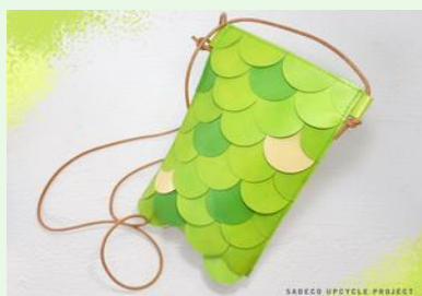
【ヌウのうろこポシェット】