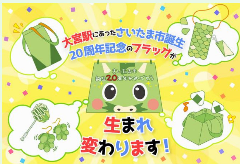
【アップサイクル企画イメージ】

大型フラッグの生地は、ポリエステル繊維の織物の両面に塩化ビニール樹脂加工したターポリンという生地で、布や塩化ビニールシート単体の生地よりも強度が強く耐久性に優れています。この丈夫な生地を活用して、オンラインストア「サデコMONOがたり」やデザイナー、市内障害者施設の協力により、ポシェットやペンケースに生まれ変わらせました。また、「J:COM presents 2022 ツール・ド・フランスさいたまクリテリウム」の懸垂幕等をアップサイクルした商品も製作しました。