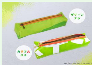
【ヌウのペンケース】