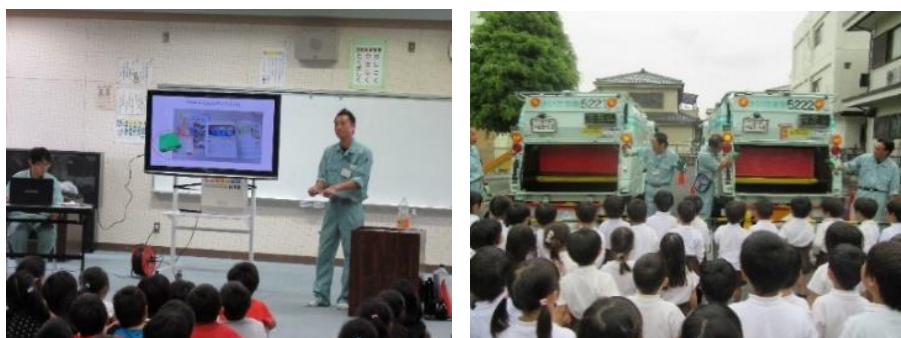
【ごみスクール開催の様子】

小学4年生を対象とすることから、社会科の授業の一環であることから、統一した内容で啓発する必要があるため、各清掃事務所職員の相互交流を行い内容の充実を図っています。