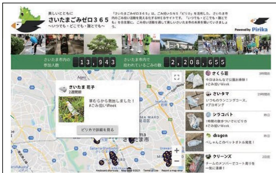
【清掃活動を見える化するWEBサイト「さいたまごみゼロ365」】

また、令和3年度には清掃活動を見える化するWEBサイト「さいたまごみゼロ365」を開設し、日常的な市民清掃活動の普及・啓発を推進しています。令和4年度のピリカを活用したごみ拾い参加人数は延べ8,228人となりました。