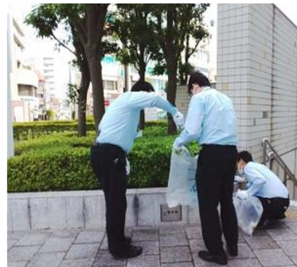
【令和4年度さいたま市ごみゼロキャンペーン市民清掃活動】

令和4年度は5月28日(土)から6月26日(日)の任意の日に参加団体ごとに分散して清掃活動を実施しました。