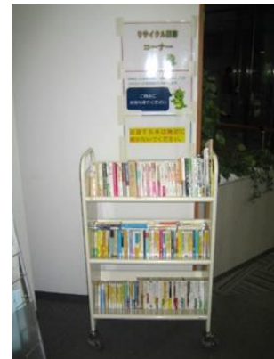
【リサイクル図書コーナー (中央図書館)の様子】