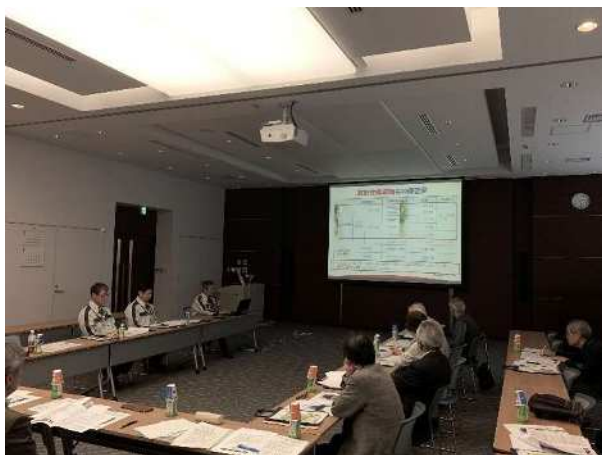
三菱マテリアル株式会社事業報告

三菱マテリアル株式会社では、この説明会を継続して実施しており、市民への積極的な情報公開を行っています。