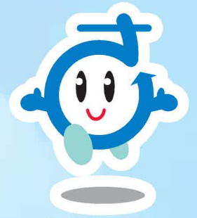
さいちゃん (さいたま市環境キャラクター)