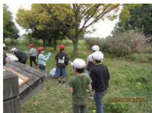
ひろば むしさが 広場 虫探し