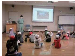
けんしゅうしつ 研修室