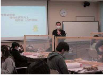
幼児政策課の説明

10月28日(水曜日)に、幼稚園教諭・保育所保育士、認定こども園保育教諭における様々な課題に対応し、保育の専門性を高めるための実技研修の一つ「幼児の自然に対する興味・関心を育てるための自然体験」が行われました。当日は、新型コロナウイルス感染症対策を施しながら庭園で生き物に触れ、ススキの穂を使ったフクロウを作りました。また、研修室で木の実を使ったリース作りを行いました。