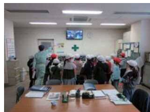
こうじょう ちゅうおうかんしつ 工場 中央監視室