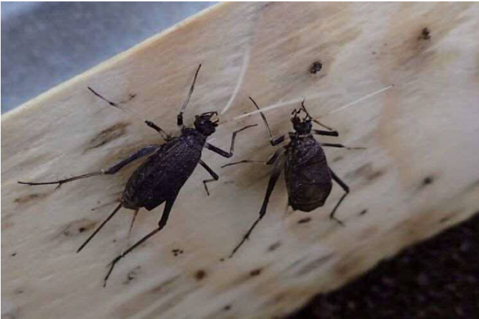
① 左がメス(産卵管が有る) 右がオス