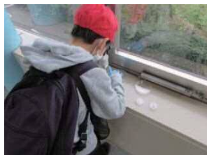
わた ろうか じつたいけんびきょう 渡り廊下 実体顕微鏡