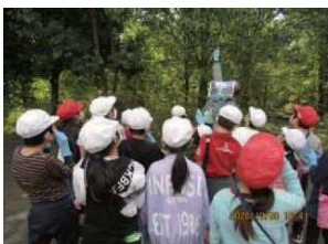
ていえん さんさく 庭園 散策