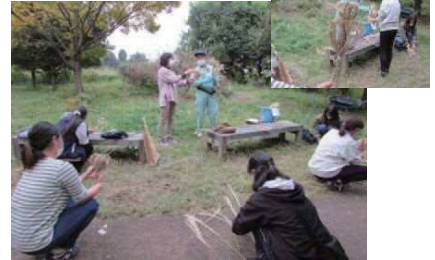
ススキのフクロウ作り