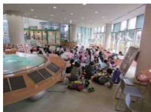
かくばしょ ぶんさん ちゅうしよく 各場所に分散して昼食