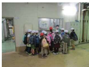
こうじょう ひりょうせいぞう 工場 肥料製造