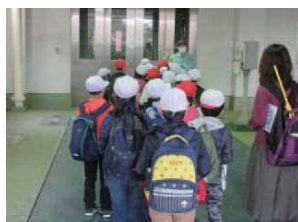
こうじょう けいりょう 工場 計量