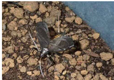
② オスが羽を広げて前羽をこすり合わせて鳴きます