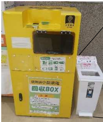
小型家電回収ボックス (黄色)