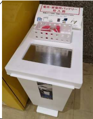
電池回収ボックス (白色)

※ 小型家電回収ボックスは、「30 cm×15 cm」の投入口から家電製品とその付属品（アダプターやコードなど）を入れることができます。