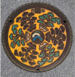
旧大宮市 35° 54' 04.0"N 139° 37' 51.1"E