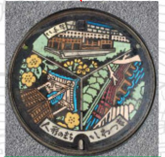
旧岩槻市 35° 57' 00.9"N 139° 41' 36.6"E