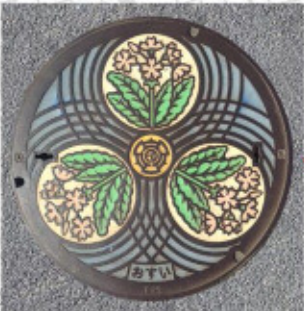
旧浦和市 35° 52' 16.6"N 139° 38' 50.5"E