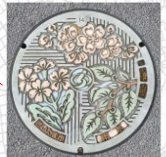
さいたま市 35° 53' 05.8"N 139° 38' 17.3"E