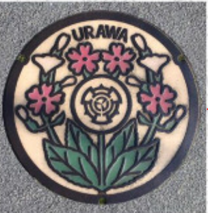
旧浦和市 35° 52' 47.4"N 139° 38' 22.5"E