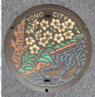
旧与野市 35° 53' 28.2"N 139° 37' 38.7"E