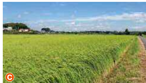
C 【見沼区八景】万年寺と片柳の田んぼ・斜面林