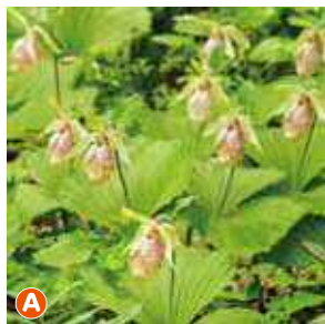
A 【見沼区八景】 クマガイソウの里 見沼区御蔵の民家で自生しているクマガイソウを見ることができます。(4月中旬～下旬)