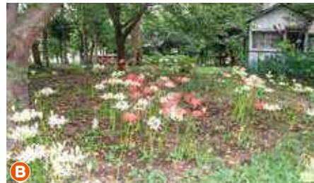
B 砂氷川社のヒガンバナ